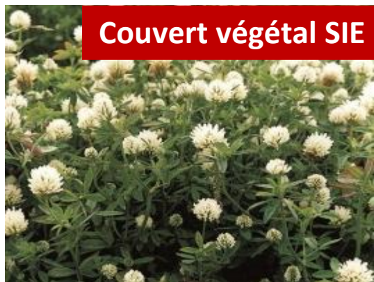
Couvert végétal SIE