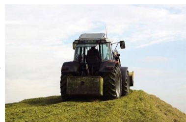
Demi-tardif ≈ FAO 230