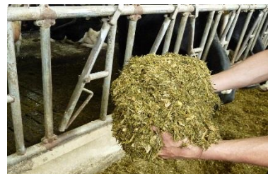
Précoce ≈ FAO 210