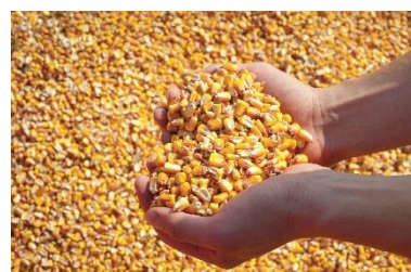
Précoce ≈ FAO 210